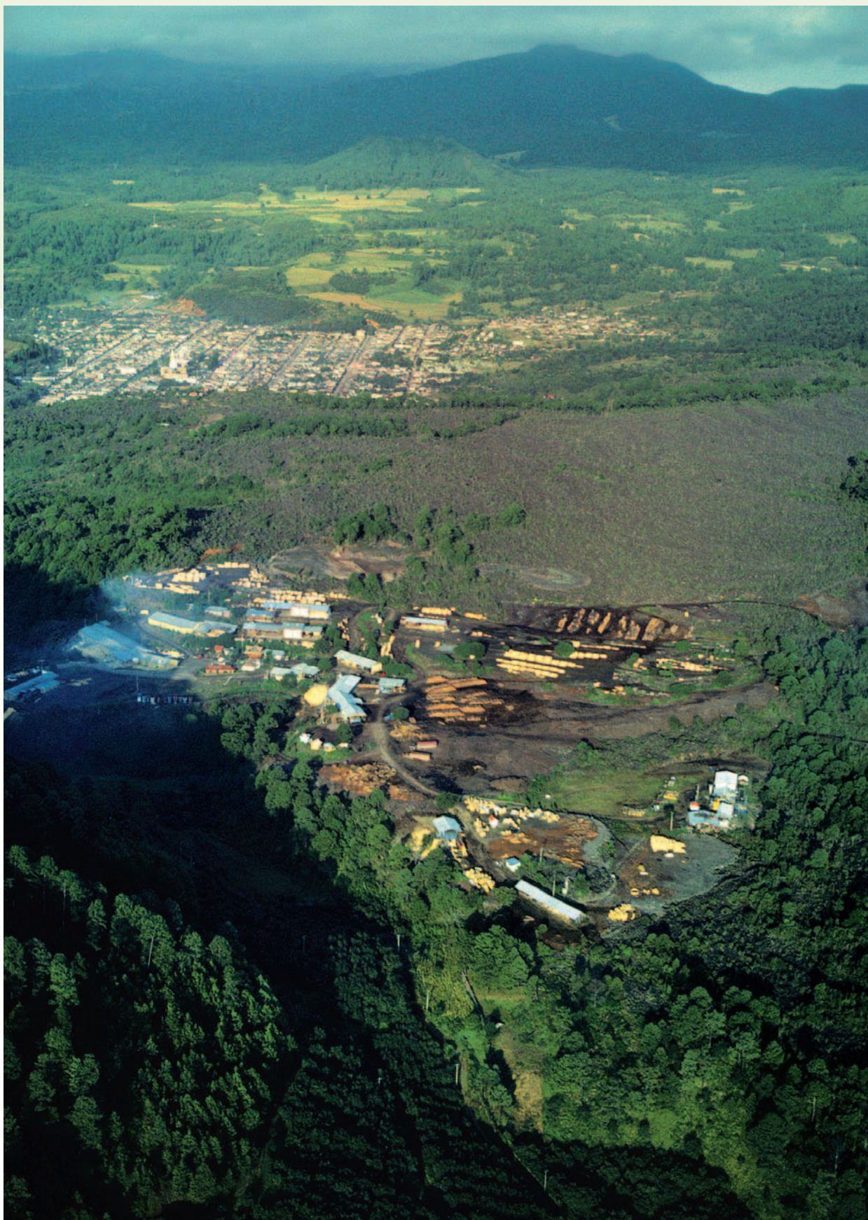
Planta industrial de procesamiento de madera y poblado de San Juan Nuevo Parangaricutiro, Michoacán